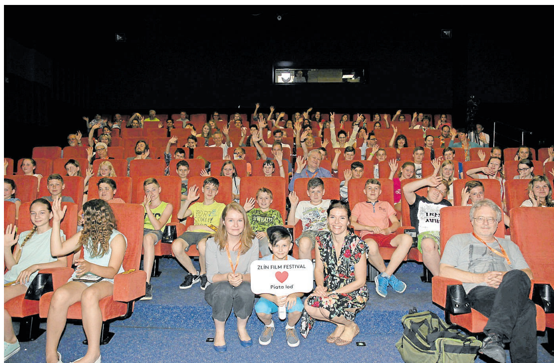
Slovenskou delegaci k filmu PÁTÁ LOĎ přijali dětská diváci s nadšením.