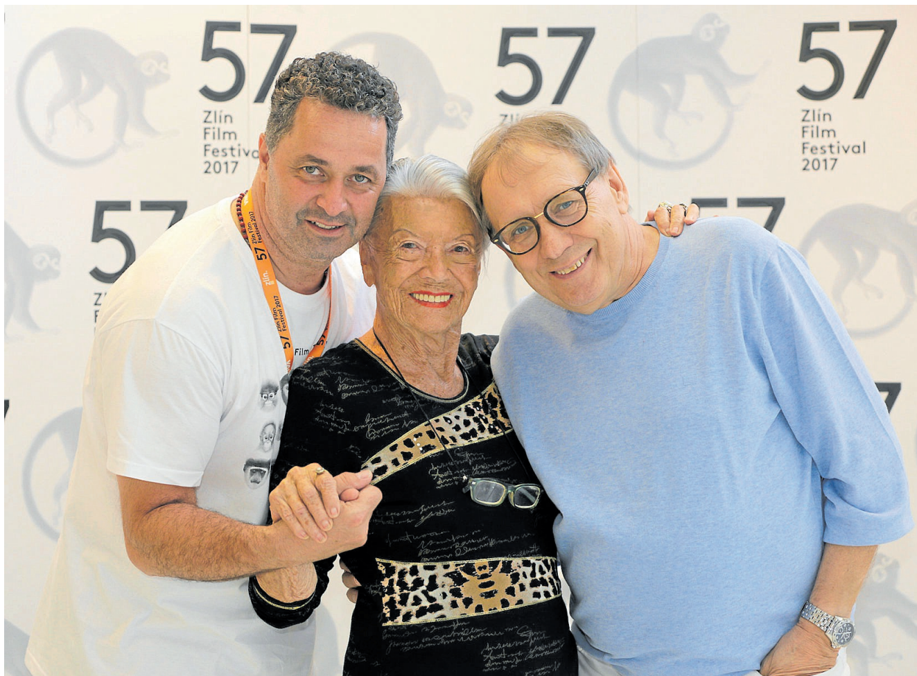
Výstavu Radost tvořit, která ocenila výtvarné práce zrakově postižených dětí, poctila svou návštěvou herečka ZDENKA PROCHÁZKOVÁ , doprovodili ji také MARTIN DEJDAR a JOSEF ALOIS NÁHLOVSKÝ .