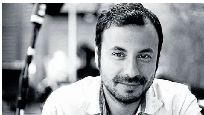
HÜSEYIN TABAK filmový režisér, Německo