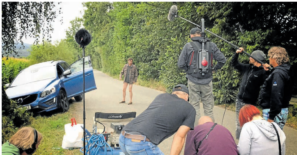
V loňském roce se ve Zlínském kraji natáčela například historická minisérie Marie Terezie či snímek Úsměvy smutných mužů.