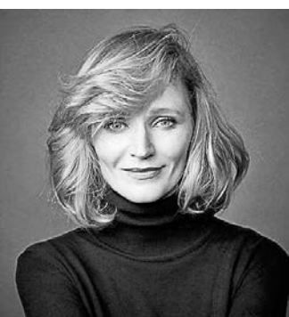
ANNA GEISLEROVÁ, filmová herečka, spisovatelka, Česká republika