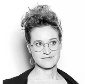
JOHANA ŠVARCOVÁ herečka, Česká republika