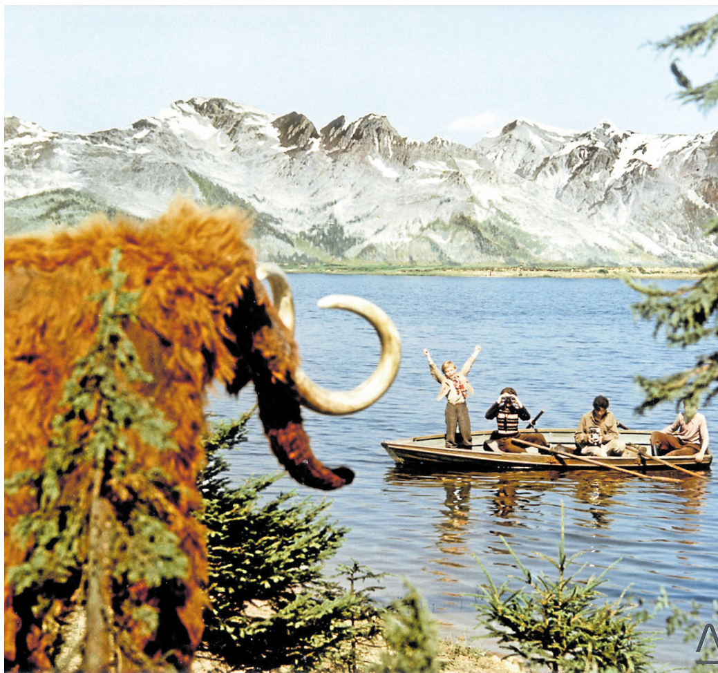
Cestu do pravěku si jako svůj srdcový film vybral filmový režisér Jan Hřebejk.

Herečka Simona Stašová pro letošní festival zvolila filmy v hlavní roli s Janem Werichem Císařův pekař, pekařův císař. „Tyto filmy znám nazpaměť a žádné Vánoce si je nenechám ujít. Dokonce z nich doma citujeme. Werichovský humor se nikdy neokouká, neoposlouchá a nepřejí. Kéž by takových bylo víc. Ale to je právě to, že pan Werich byl jeden,“ vysvětlila svoji