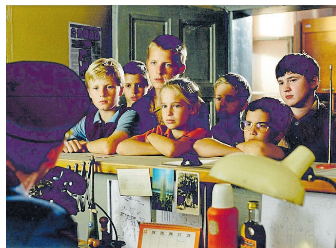
Na festivalu se v sekci Rakouský výlet bude promítat také dobrodružný snímek Tři lupiči (Die 3 Postrauber).