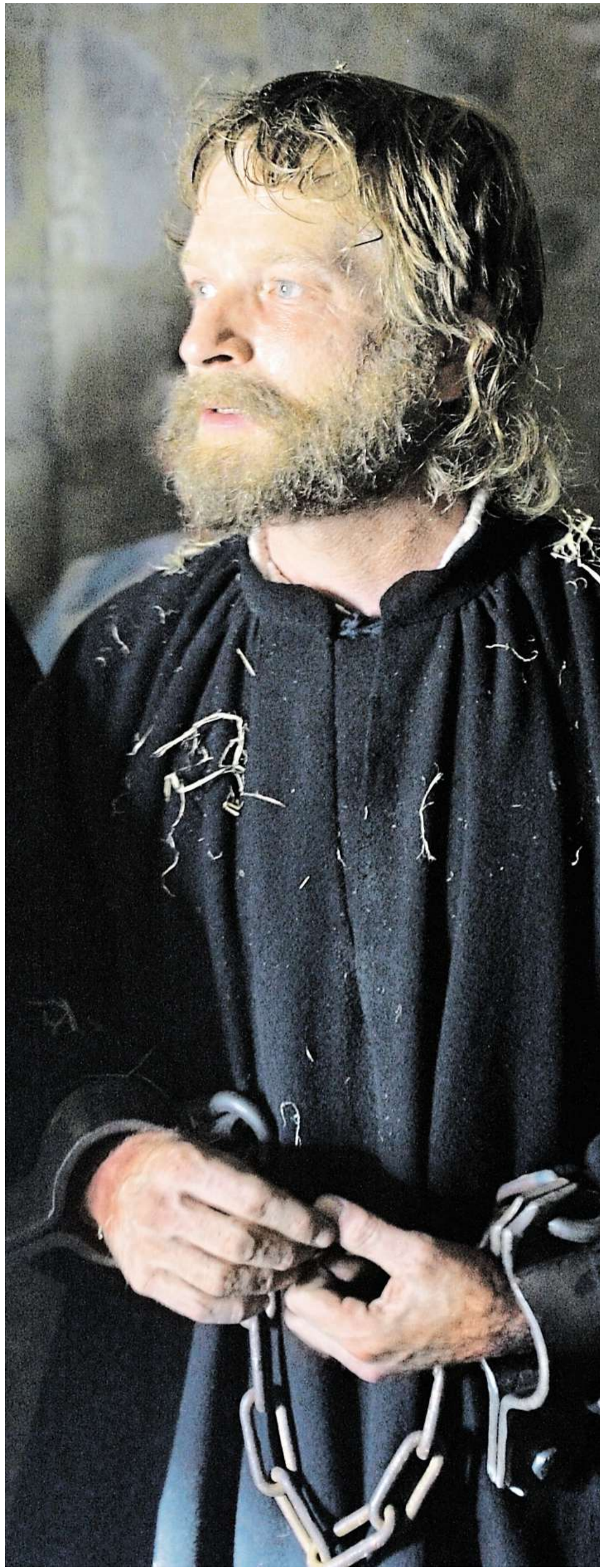
Hádek jako Hus Třídílň televizní film se promítá dnes od 20 hodin v Golden Apple Cinema 3.