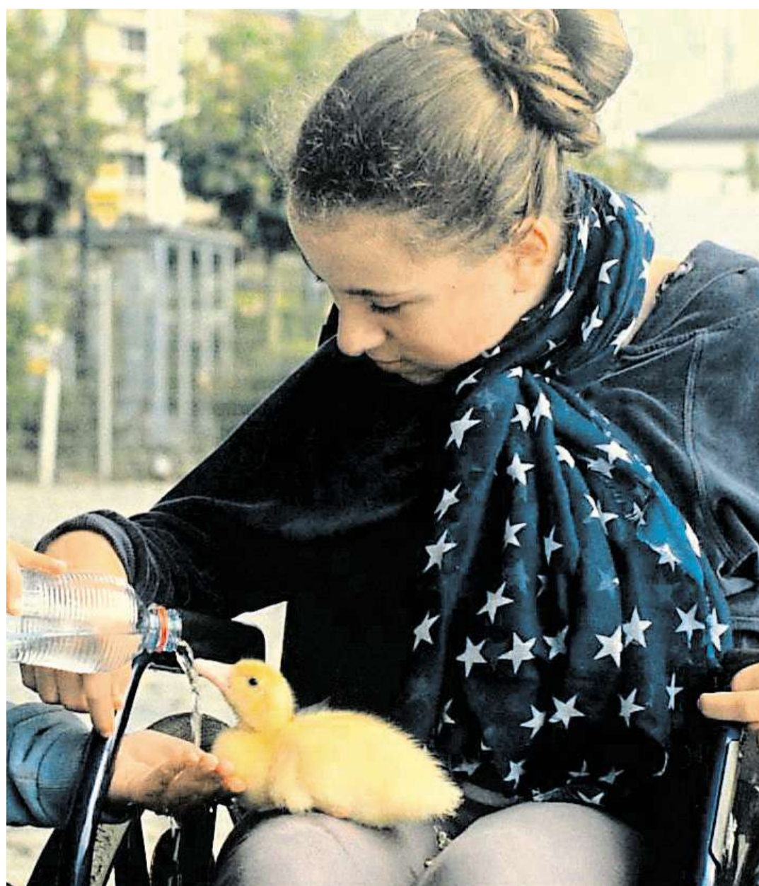
Ze soutěže Snímek Stěhovavé ptáče nabídne Golden Apple Cinema 2 v 10.20 hodin.