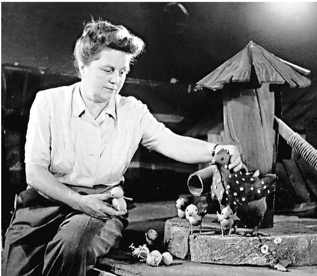
Průkopnice tuzemské animace Ve srovnání s výpravními loutkovými filmy Jiřího Trnky a Karla Zemana působí snímky Hermíny Týrlové jednoduše a jejich síla spočívá ve stylové čistotě a prostotě.