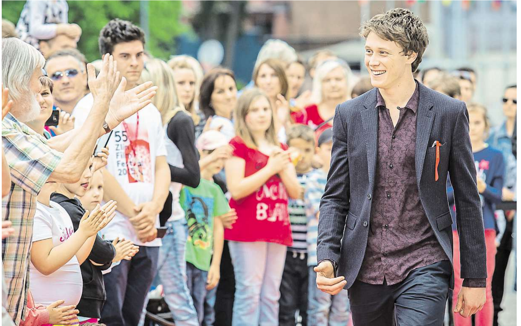
As a guest Fans welcome George MacKay on the red carpet in Zlín.

His first film role was the role of Curly from Neverland in the classic fairy tale Peter Pan directed by P. J. Hogan. He was eleven years old at that time. "Peter Pan was my first real experience with shooting of a film. It was very helpful to me. So early I was able to see how much work is put into such film. Before, I had no idea that the whole process involves so many people," says Mac-