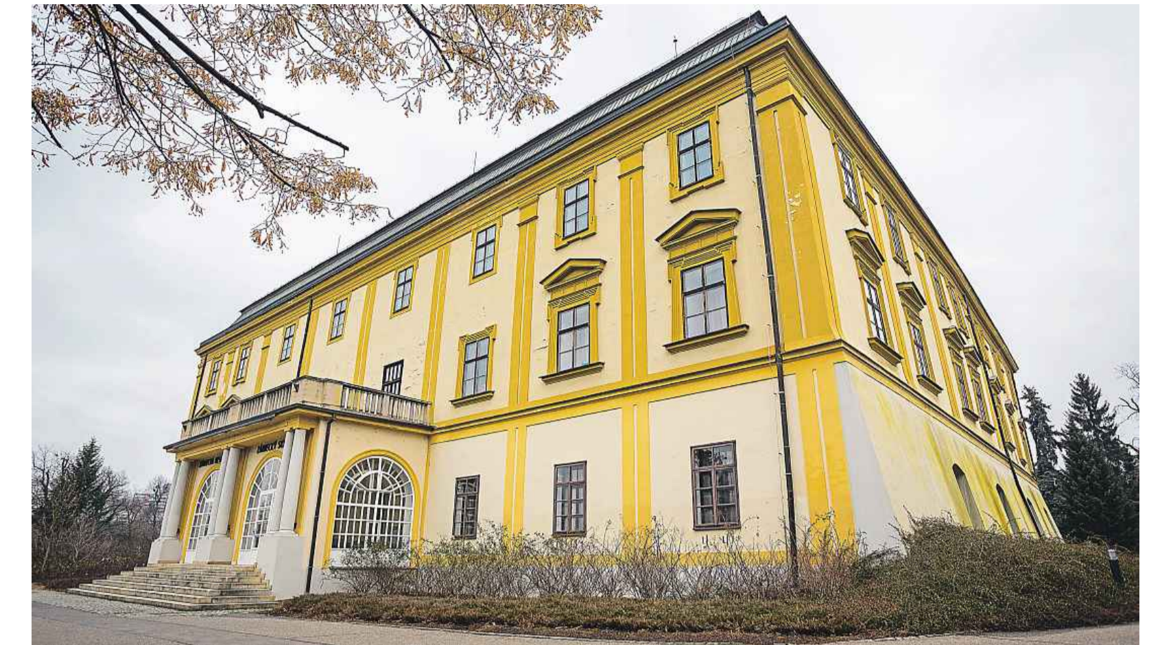
Nový účel Ve zlínském zámku do loňského roku sídlilo Muzeum jihovýchodní Moravy a Krajská galerie.

Nový nájemce, společnost Zlínský zámek, však chce spolu s radnicí nynější stav změnit a ve filmovém svátku vidí ideální příležitost,