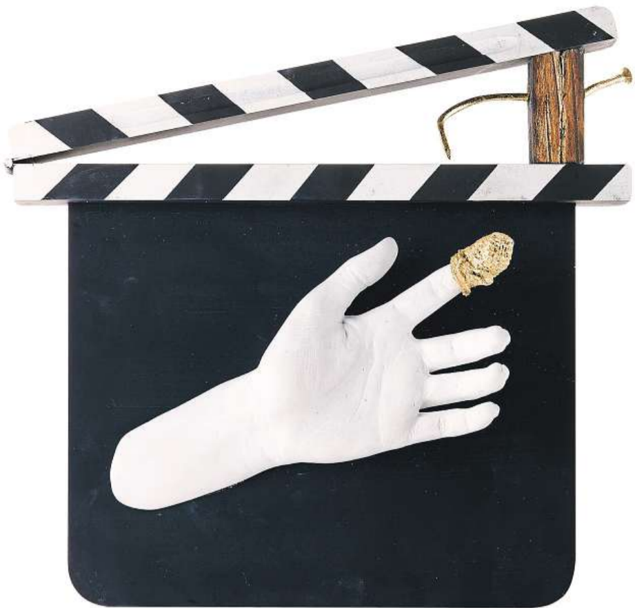
Olbram Zoubek: Bolístka